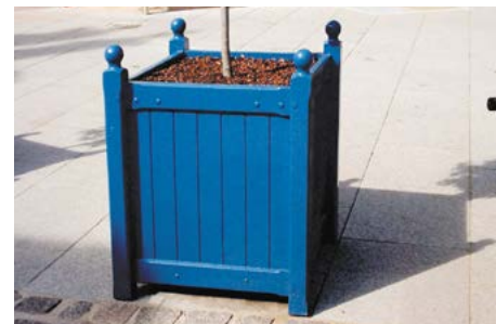
CAISSE À ORANGER

Combinaisons L x l x h : nous consulter - 825 kg - Réf. JBALOFT